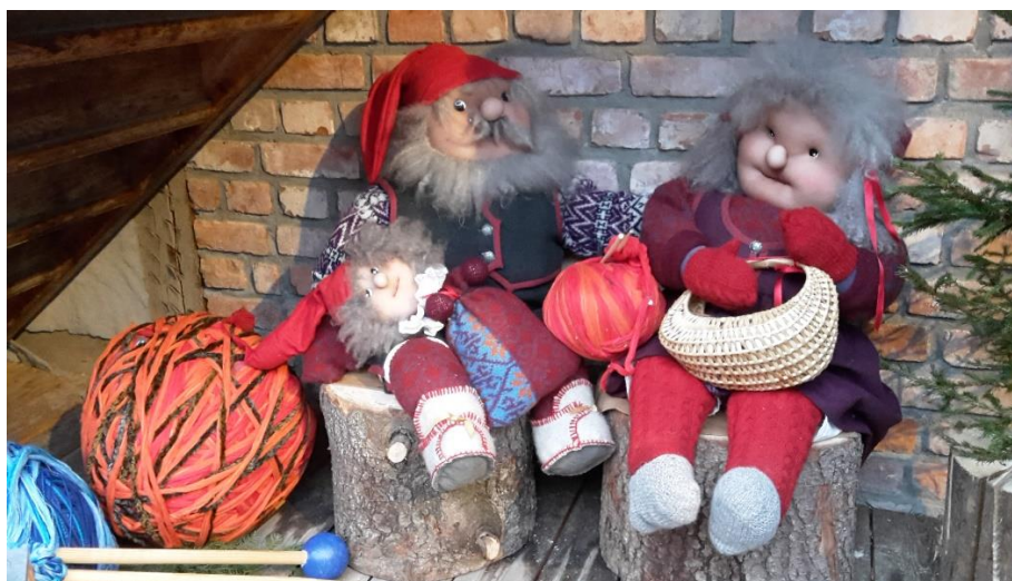
Julestemning på Maihaugen